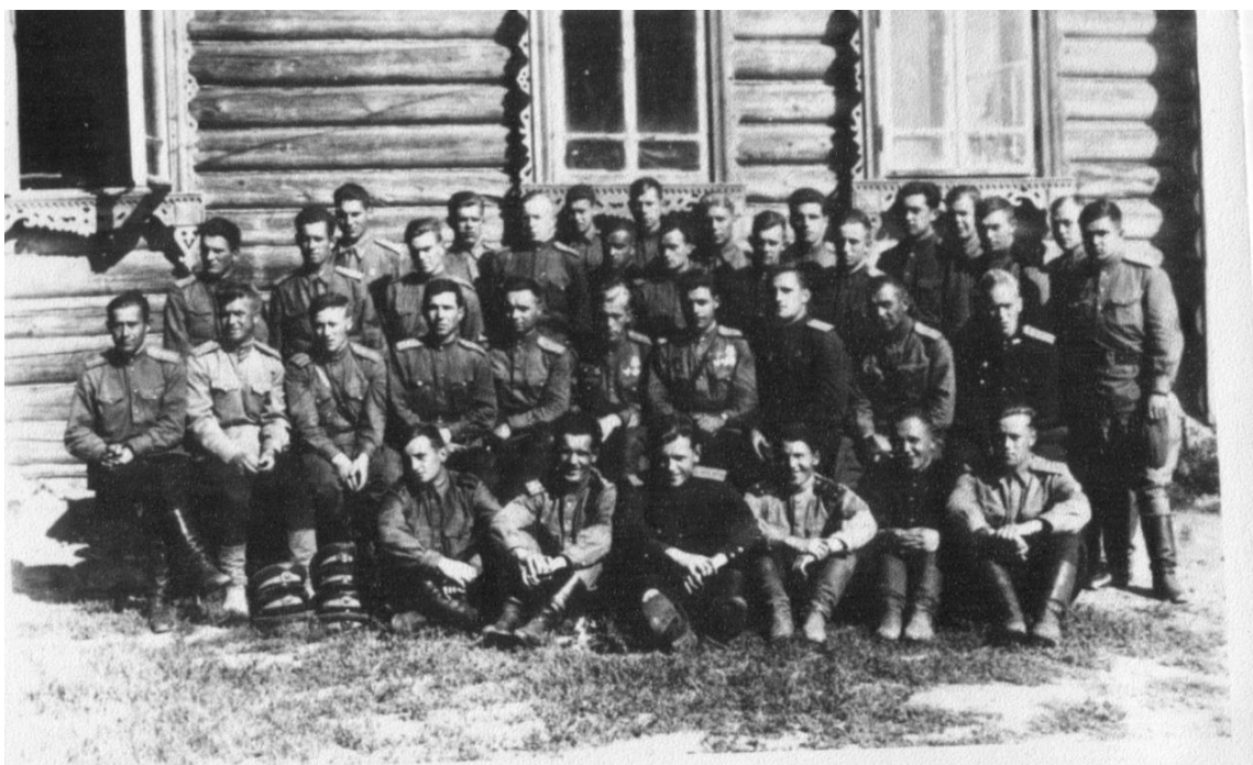
4. Летный и технический состав 42 АП Аэродром п. Свингино Рыбинского р-на. [Фотография] // Архив музея 42АП. № 3050