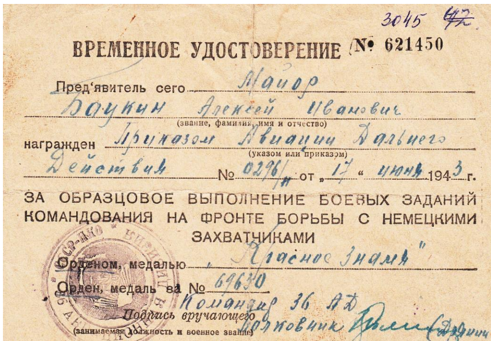
3. Временное удостоверение о награждении орденом Красного Знамени. [Фотография] // Архив музея 42АП. № 3045