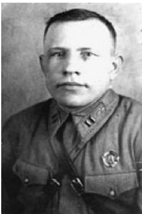
2. Герой Российской Федерации Баукин А.И.