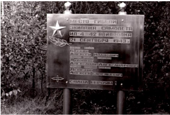
7. Место гибели экипажа. 20.08.1983г.