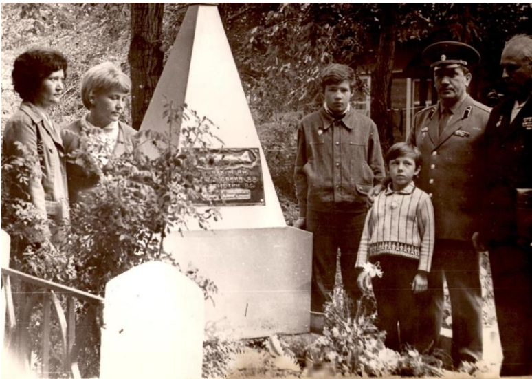
8. Памятный митинг.[Фотография] Дата неизвестна // Архив музея 42АП. № 3051