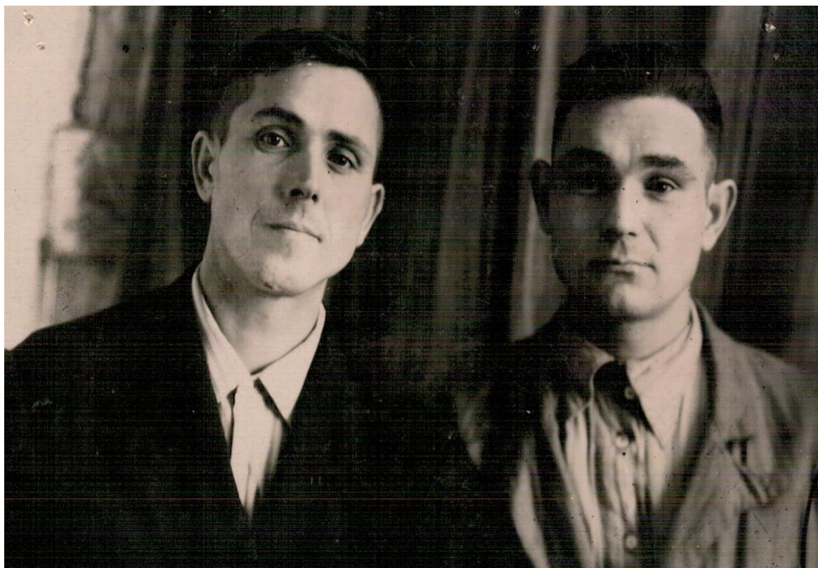
Нурмухамет с братом