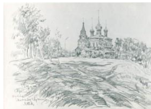
Церковь св.Михаила Архангела