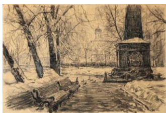
Демидовский садик. 1960

Среди пейзажей виды Ярославля и окрестностей, Рыбинска, Суздаля, Ростова Великого, Загорска, Владимира, Ленинграда и др. городов.