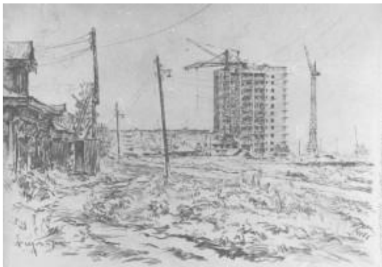
Ярославль строится, 1970 г.

А также художник изображает возрождение и обновление городов.