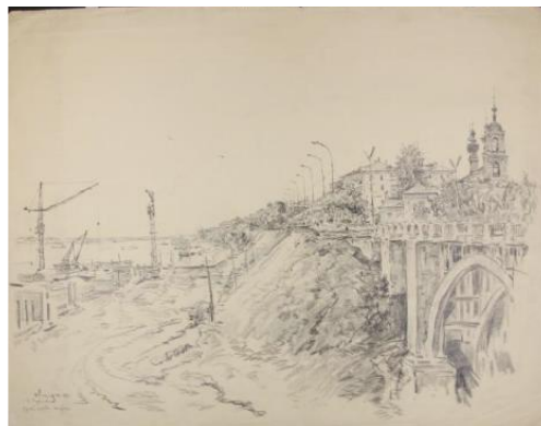
Ярославль. Строительство порта. 1973

Несколько рисунков посвящает художник Красному Перекопу г. Ярославля. Вот одна из таких работ. На рисунке изображён парк «Красный перекоп» и Церковь Петра и Павла. Рисунок относится к 1979 году