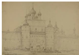
Ростов Великий. 1948

Внимание художника останавливается на храмах.