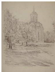
Владимир. Дмитриевский собор. 1973

Внимание художника останавливается на храмах.