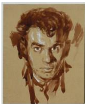
Автопортрет. 1947 г.