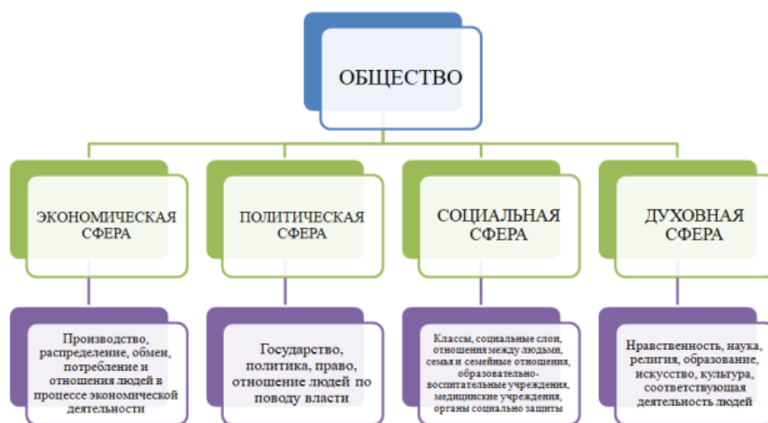
Рис. 1. Схема четырех сфер общества и их краткое описание

Эта исследовательская работа направлена на изучение последствий коронавируса с нескольких позиций: с позиции влияния вируса на политическую, экономическую, социальную и духовную сферы общественной жизни. Работа станет неким “собранием” всех позиций, сфер, аспектов, которые претерпели изменения вследствие пандемии.