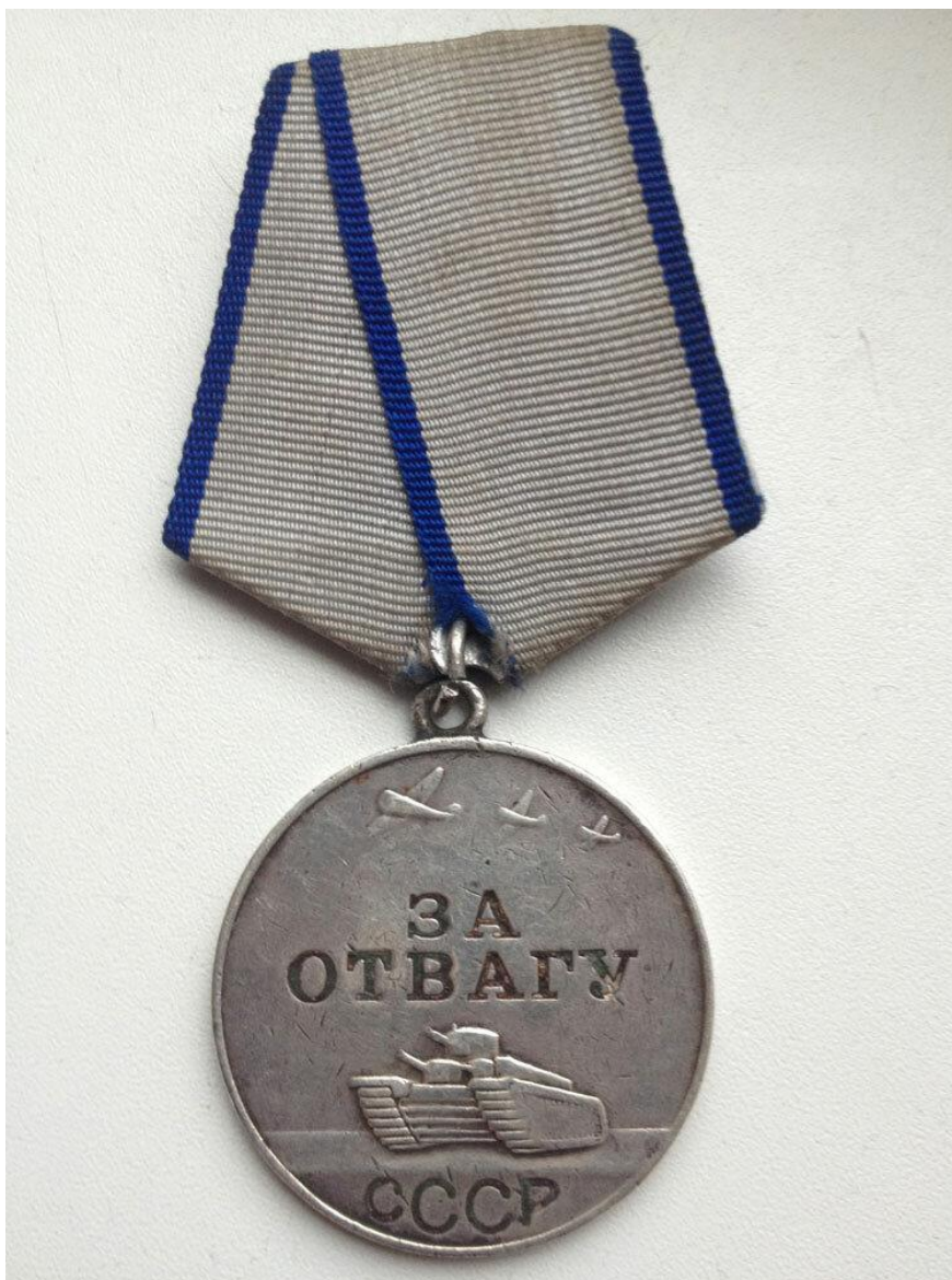
Боевая медаль «За отвагу»