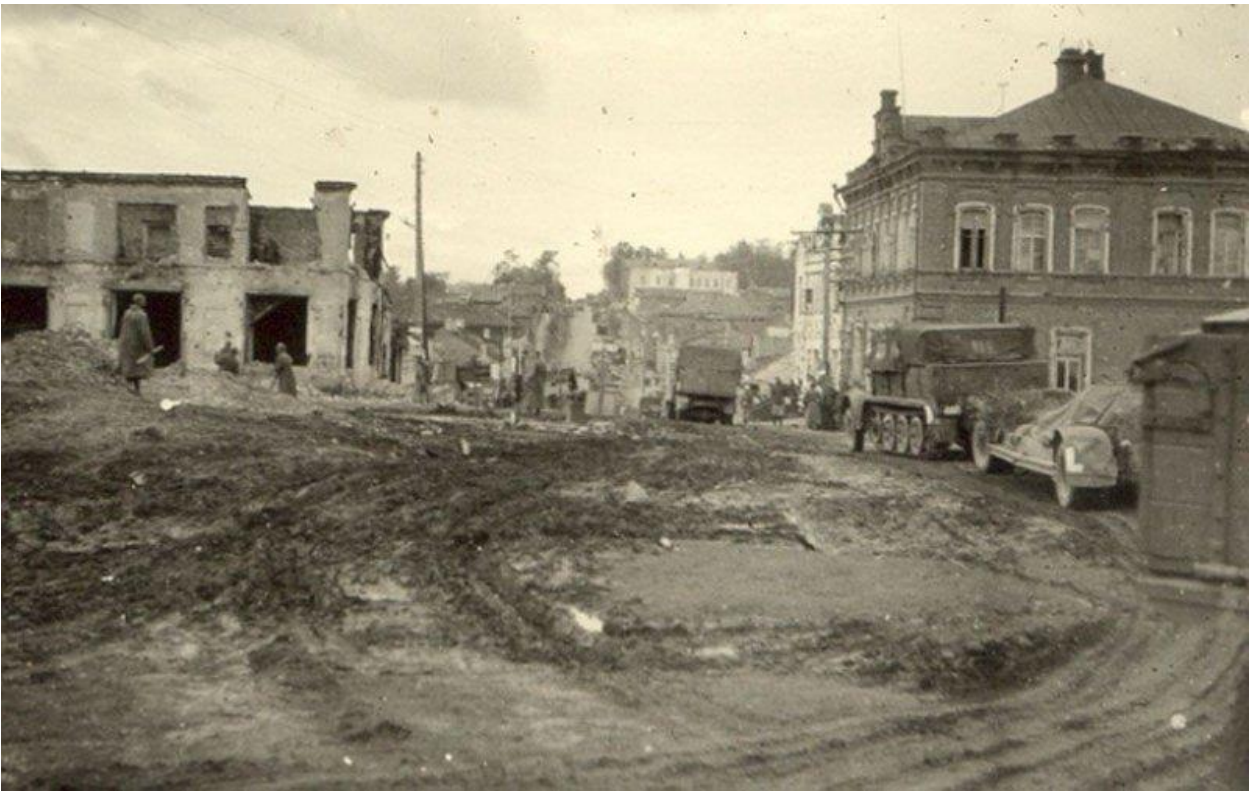
город Духовщины Смоленской области после освобождения воинами Красной армии от фашистов