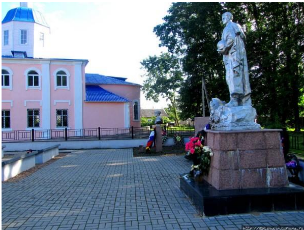
Мемориал солдатам 306 Стрелковой дивизии в городе Духовщина