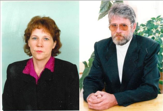
Мои бабушка и дедушка работали в одной школе