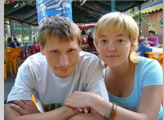
Мои папа и мама учились в одной школе и сидели за одной партой;