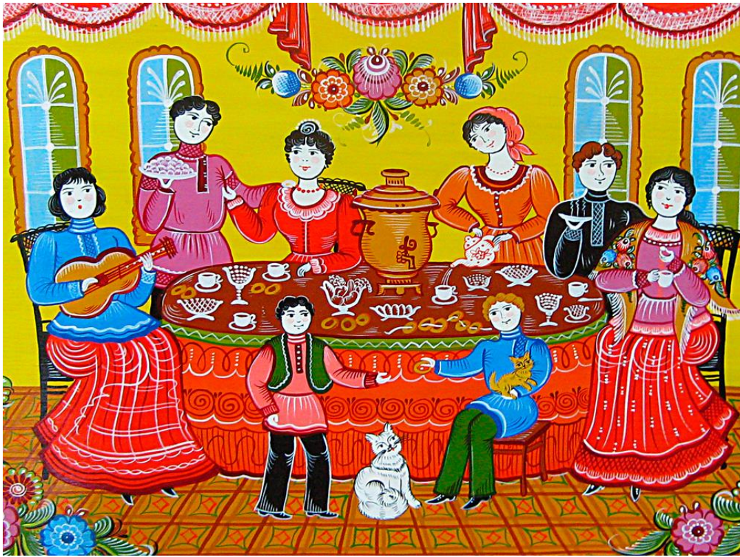
Панно. «Мой любимый городец». Колесникова

Городецкие мотивы, сцены городецкой жизни.