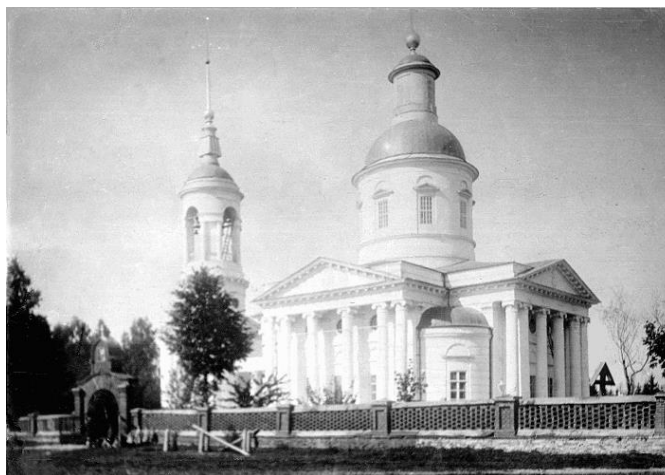
Рисунок 2 «Фото храма предположительно начало XX века»

Домом Божиим издавна называет народ городские и сельские церкви. Поэтому с давних времен люди старались сделать так, чтобы всё в церкви были особенным, величественным и красивым. И это поистине