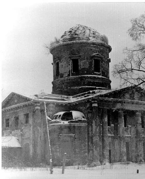
Рисунок 6. Разрушенный храм

В годы войны 1941-1945 гг. храм был значительно разрушен (рис.6). В 1945 году, когда стали проводить воду, разрушили ограду вокруг церкви, колокольню (открыли на ее месте продуктовый магазин). Сломали надгробные плиты, снесли кресты с могил, разрушили захоронения. В парке, вокруг дома помещика Пусторослева были спилены вековые липы, уничтожен фруктовый сад. В годы советской власти в разное время в храме располагалась школа, инкубатор, склад, пивной цех, магазины.