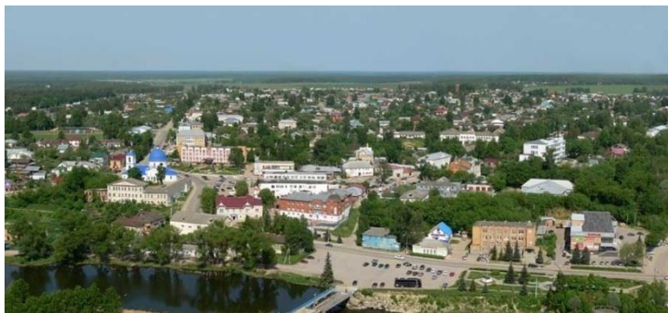
Рисунок 1. Город Кондрово

Город Кондрово (рис.1) – это часть Калужской области. Город со своей историей, со своими памятниками и своими святынями. На территории города находят 2 храма – это