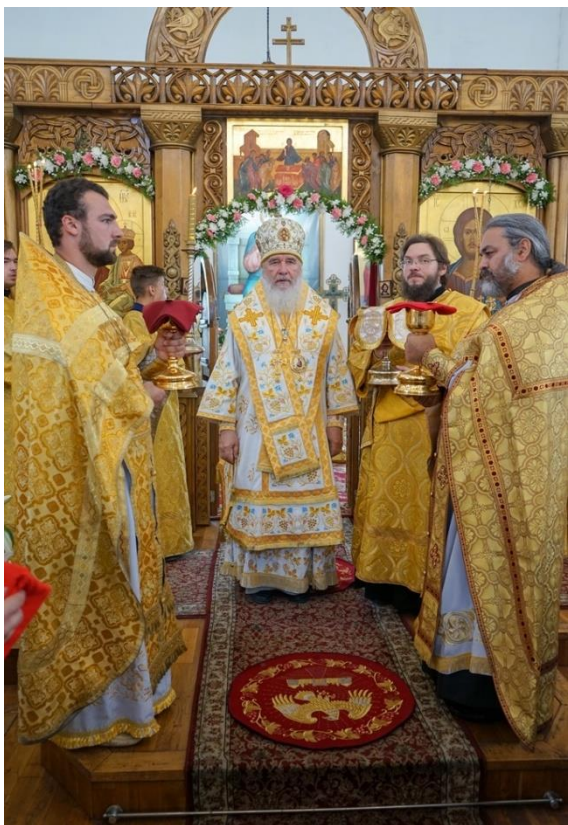
Рисунок 8. 200-летие храма

По окончании богослужения владыка поздравил настоятеля и прихожан храма с 200-летним юбилеем: «В 2018 году храм в честь Святой Живоначальной Троицы празднует свое двухсотлетие. Сейчас мы находимся в этом великолепном возрожденном Божием доме, где даже в страшные годы гонений не прекращалась молитва людей, оставшихся верными Христу. И на протяжении всей своей истории он был храним Богом и людьми!», - цитирует митрополита Климента прес-