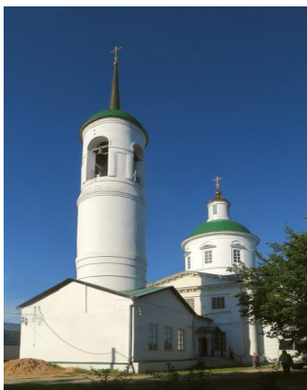
Рисунок 7. Восстановленная колокольня храма

Первый благовест раздался в праздник Светлого Христова Воскресения, 30 апреля 2000 года (рис 7).