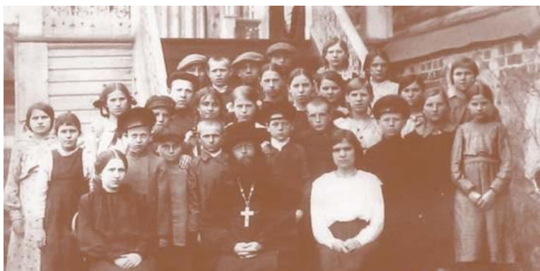
Рисунок 5. В центре – отец Владимир Преображенский, перед событиями октября 1917 г.

Наступило трагическое время для России - октябрьский переворот 1917 года. Именно протоиерею Владимиру Георгиевичу Преображенскому, суждено было стать последним