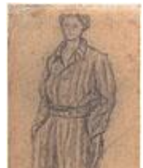
Заключенная в полосатой лагерной робе. 1944 г.