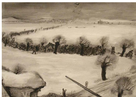
Прибытие Транспорта, Терезиенштадт Гетто, 1942

Находясь в Ниско, Хаас писал портреты солдат СС, за что получал лучшую еду и художественные материалы. Он также мог свободно перемещаться по лагерю, что позволило ему рисовать строительные площадки, портреты своих товарищей, транспорты, прибывающие и покидающие, и общую