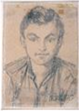
Портрет молодого мужчины 1944