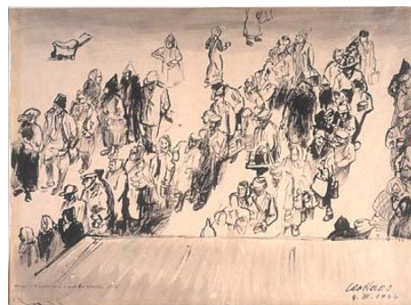
Распределение продуктов питания 4 марта 1944 г.