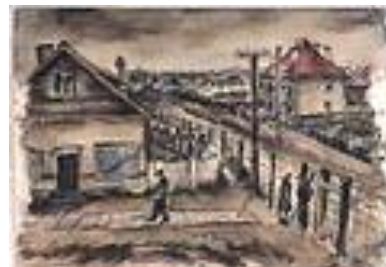
Вечер опустился на Вильямпол, Ковенское гетто 1956, по рисунку от 1941 г.