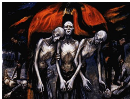
Их последние шаги

После освобождения он создал десятки рисунков и картин, которые показывали жизнь и смерть заключенных. Работы Олера дают реальное представление о том, что, на самом деле происходило в Аушвице.