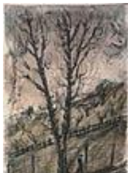
Дорога в Форт Нинт, на казнь 1960 г. по рисунку 1941