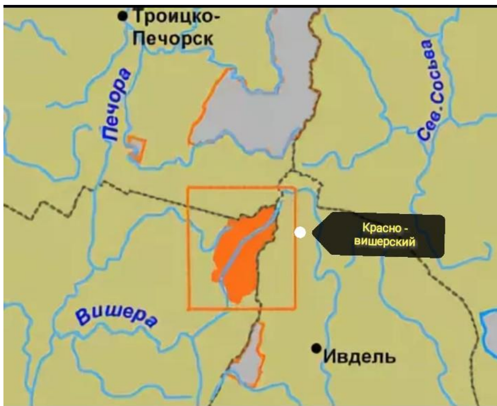
Приложение 2. Карта заповедника Басеги [2].