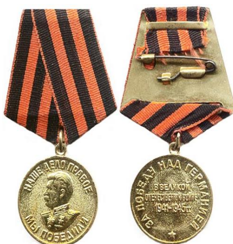
Медаль «За Победу над Германией в Великой Отечественной войне 1941-1945гг»