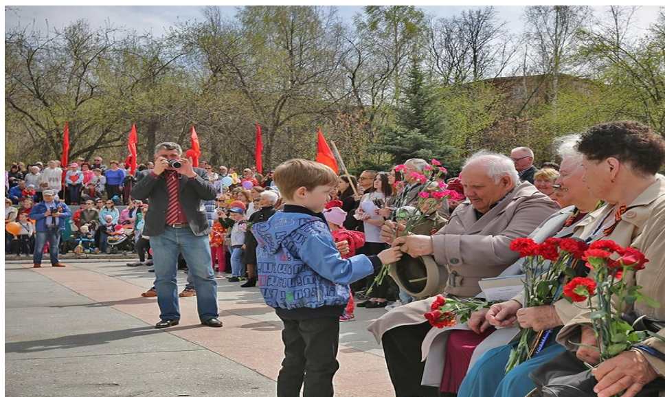
Митинг в память об участниках войны в г.Верхнем Уфалее