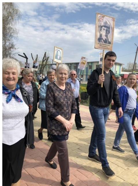
Я и моя семья участники акции «Бессмертный полк»