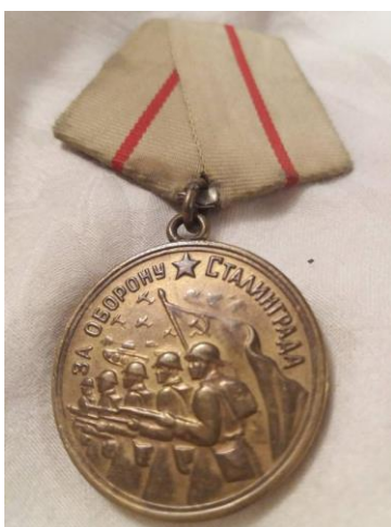
Медаль за оборону Сталинграда