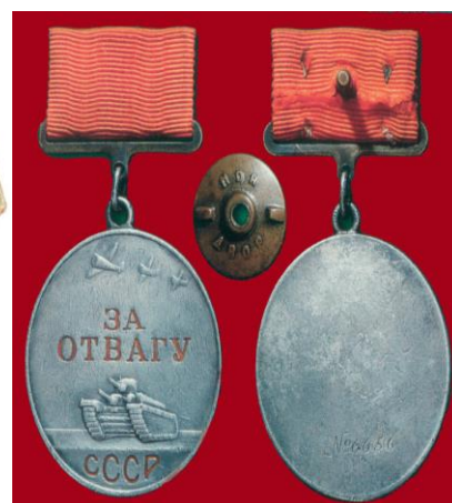
Медаль За отвагу