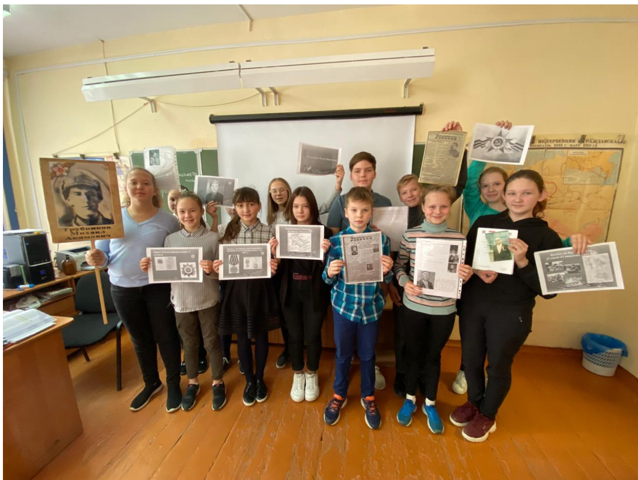
Я и мои одноклассники с фотографиями и материалами о боевом пути своих прадедушек и прабабушек