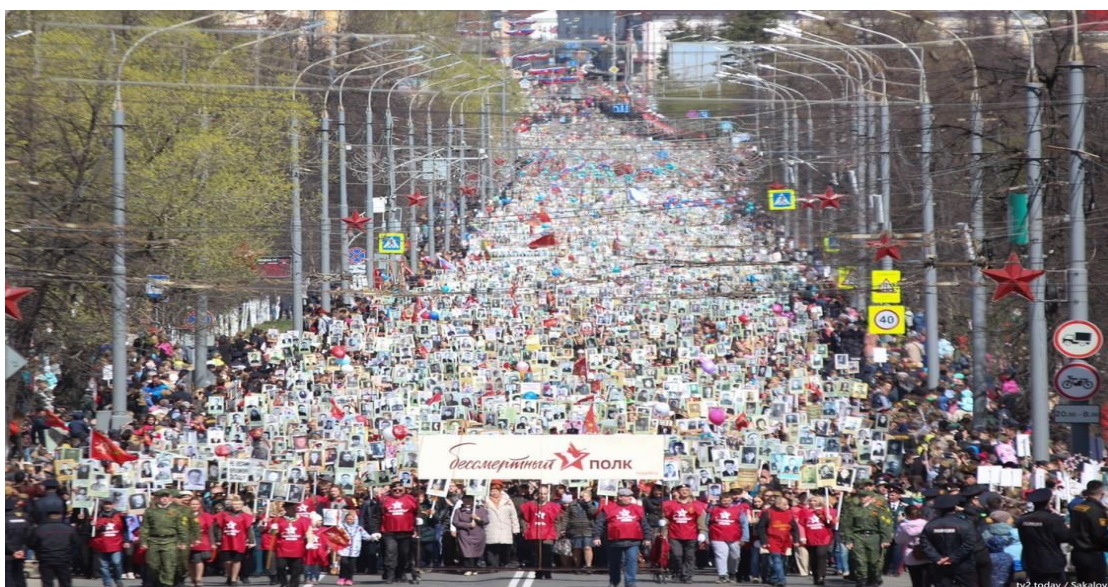
Бессмертный полк в Томске 9 мая 2019 года