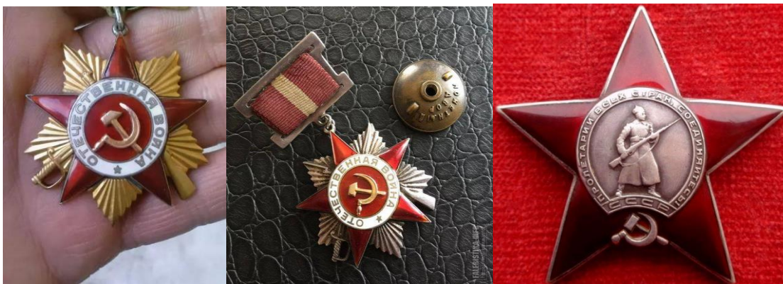
Орден Отечественной войны 1 степени