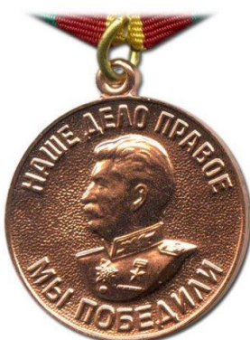
Медаль за доблестный труд в Великой Отечественной войне 1941-1945 гг