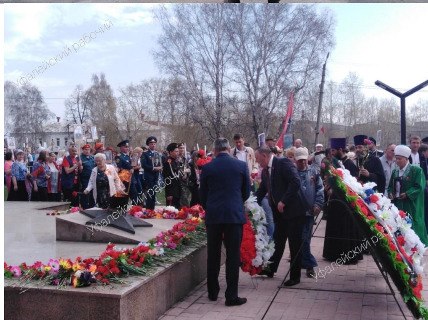
Акция «Бессмертный полк» в моем городе Верхнем Уфалее