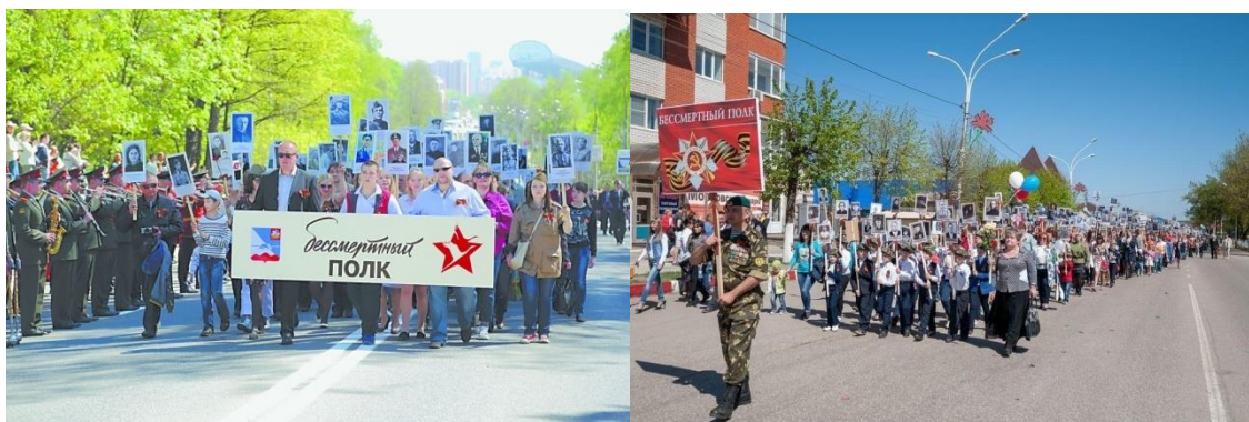
Бессмертный полк в Томске 9 мая 2012 года