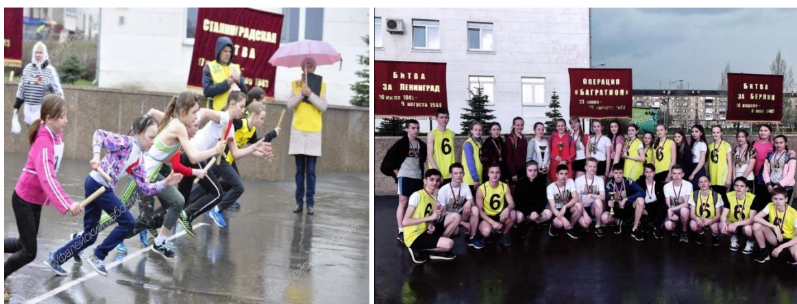
Легкоатлетическая эстафета ко дню Победы в г.Верхнем Уфалее